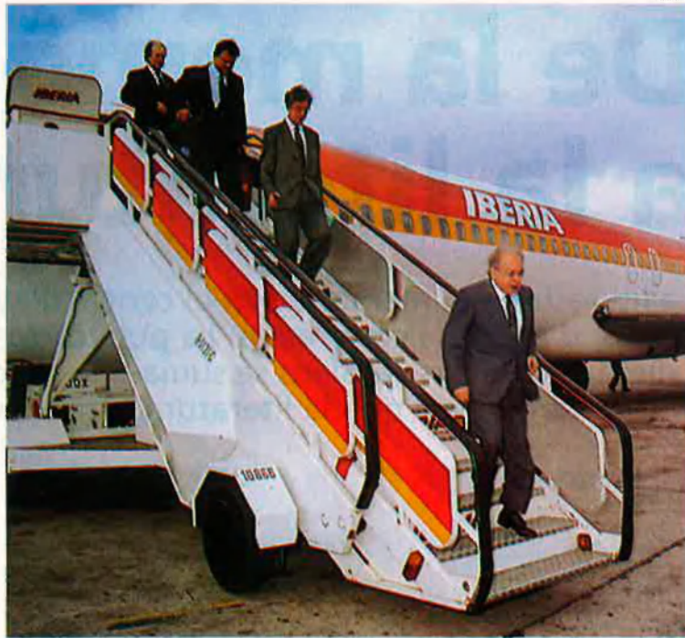
Jordi Pujol, en una visita anterior a Palma, convidat per l'Obra Cultural Balear. Al desembre, el president de la Generalitat de Catalunya tornarà a les Illes gràcies a l'OCB, però aquesta vegada serà rebut en audiència pel president balear, ara Francesc Antich.

La Nit de la Cultura. Precisament per demostrar aquesta condició d'entitat de referència social i cultural, l'OCB ja prepara la Nit de la Cultura 1999 (el dia 17 de desembre al vespre, quan s'atorgaran els Premis 31 de desembre), que promet ser tota una "demostració de força". L'assistència institucional serà plena per primera vegada. Hi han confirmat la presència el president de les Illes Balears, Francesc Antich (el qual sempre ha volgut