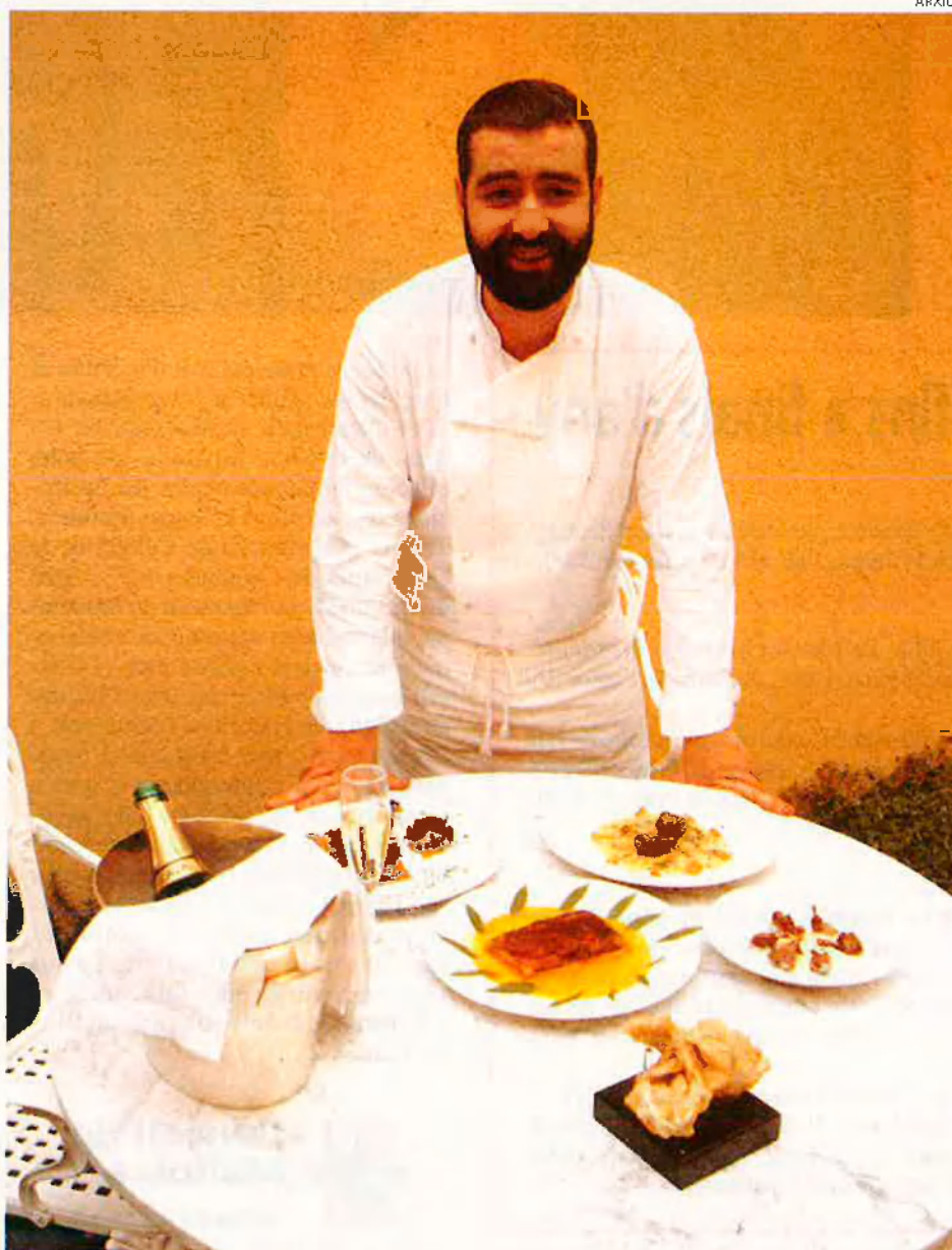
Santi Santamaria, el coc del Racó de can Fabes, es reclama com a nacionalment català. Aca- ba de publicar el llibre L'ètica del gust , premiat pel Saló Internacional de Cuina de Versalles.

La gastronomia dels Països Catalans compta des de fa alguns anys amb dos del millors cuiners del món, Ferran Adrià i Santi Santamaria. Però deixant a banda l'adscripció nacional de tots dos, la cuina d'autor té els seus riscos i les seves incomprensions.