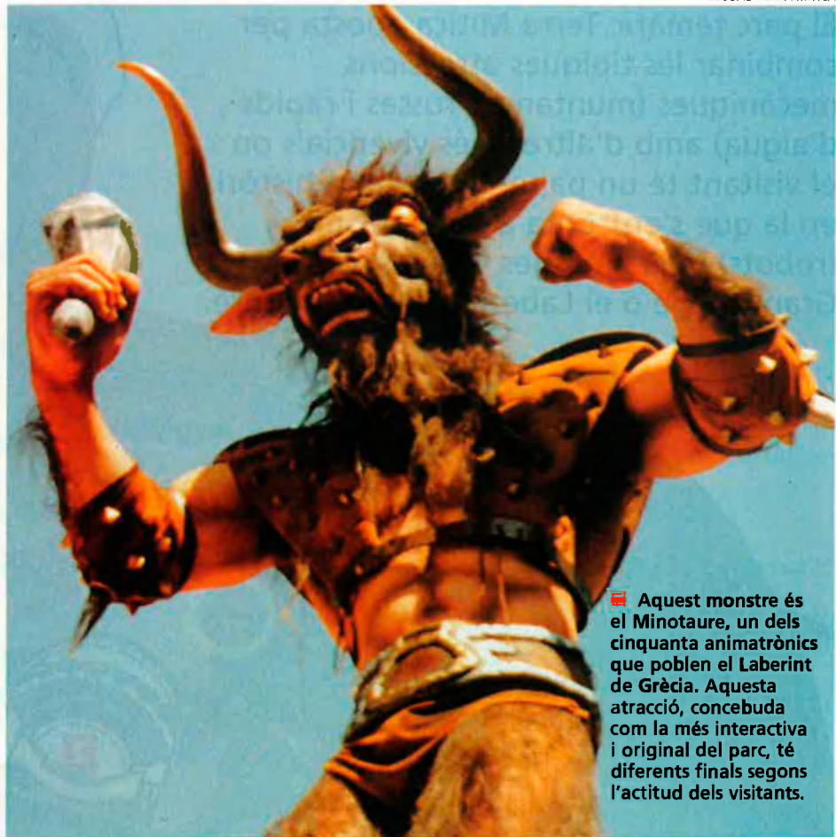
■ Aquest monstre és el Minotaure, un dels cinquanta animatrònics que poblen el Laberint de Grècia. Aquesta atracció, concebuda com la més interactiva i original del parc, té diferents finals segons l'actitud dels visitants.

En el recorregut del laberint, "amb una escenografia molt realista", hi apareixen més de cin-