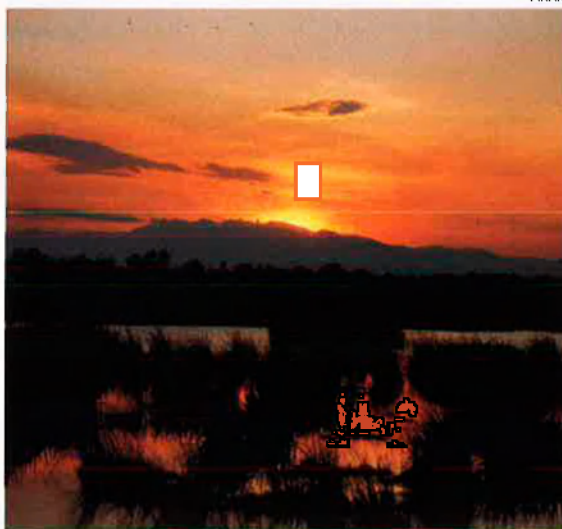
Aiguamolls de l'Empordà. L'exposició recorre tots els espais naturals protegits de Catalunya.

Així, s'hi pot veure el Parc Nacional d'Aigüestortes i l'estany de Sant Maurici (l'únic parc nacional de Catalunya); els parcs naturals de Montserrat, del Cadí-Moixeró, del Delta de l'Ebre, dels Aiguamolls de l'Empordà, del Cap de