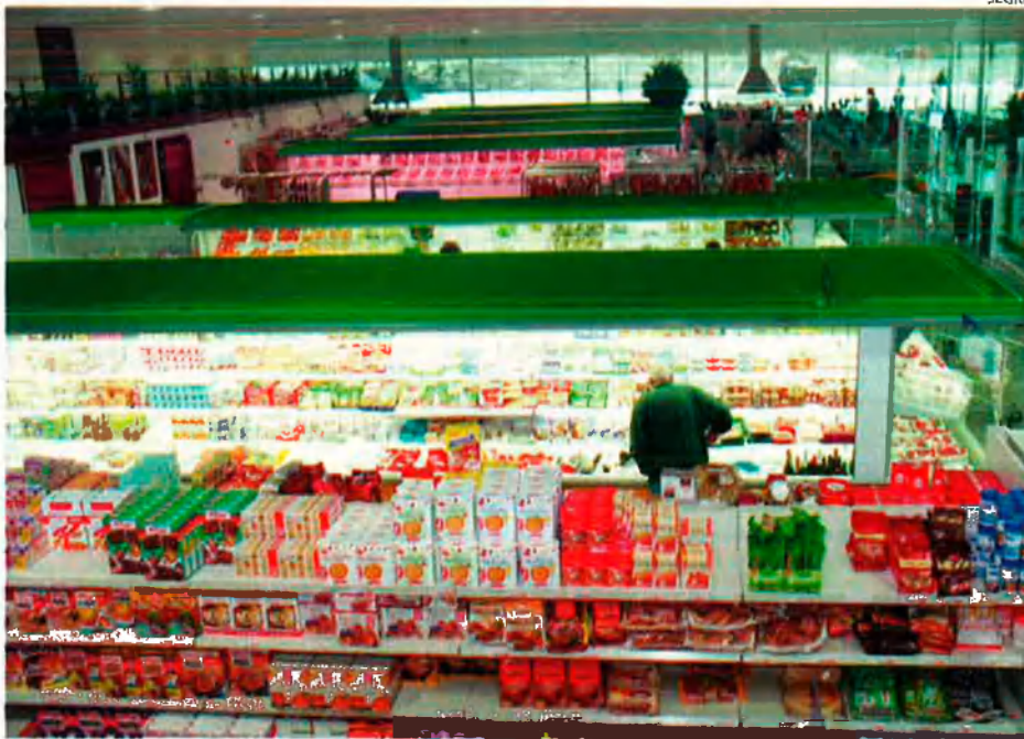
Àrea de Guissona és l'empresa que comercialitza els productes de la Cooperativa. Ara compten amb cent quaranta botigues i pensen arribar a tres-centes d'aquí a pocs anys.