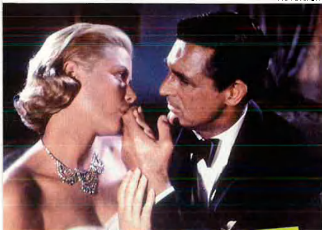
CARY GRANT GRACE KELLY