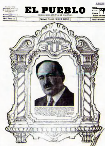
Blasco Ibanez i 'El Pueblo'. Contribuïren a la formació del mite de Ripoll.

Fins i tot el periòdic La Bandera Federal va obrir el juny de 1893 una subscripció per a dedicar-li una placa de ferro fos. Un fet que motivaria una certa polèmica quan l'alcalde de València es va negar a deixar que la placa s'instal·lara a l'exposició de Belles Arts que tenia lloc a la Llotja de la ciutat. Aquest rebuig enaltí, com diu Laguna, "el valor del màrtir". La lluita desfermada provocà finalment que a través del regidor republicà Ricard Ibanez es proposara posar el nom del mestre Ripoll a la plaça de la Constitució de Russafa. Una acció que seria durament criticada per Las Provincias i per La Correspondencia de Valencia . L'ajuntament tombà la proposta, i molt emprenyats, els republicans organitzaren un acte de protesta el 9 de desembre de 1893 al teatre Pizarro en