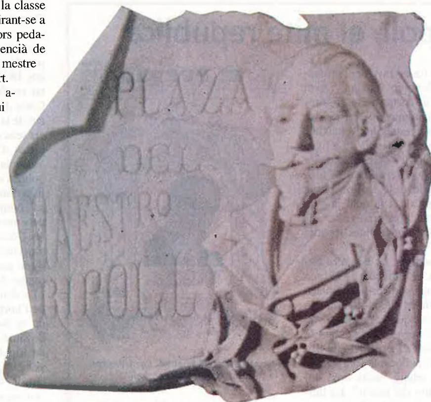
Placa del mestre Ripoll que degué d'estar posada durant els anys de la República a l'actual plaça de Sant Valero del barri valencià de Russafa. Aquesta placa és la que molt probablement finançaren els republicans valencians per retre homenatge a un dels seus mites més importants.

La coneixença de Ripoll, dèiem, causà una gran impressió entre els habitants de l'horta. Tal i com ex-