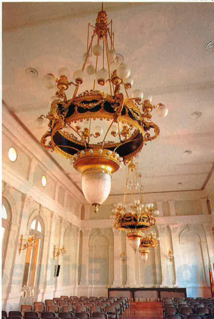
Imatge del Casino Setabense de Xàtiva. Hi ha locals d'aquestes característiques que guarden a l'interior sales ricament decorades, record d'èpoques d'esplendor.

Aquests locals típics del segle passat, situats en la majoria de pobles valencians a prop de l'església o de la casa gran, han estat aprofitats per institucions diverses de cada municipi. Així les entitats musicals tenen molta relació amb els casinos, com és el cas del de Benimaclet, del de la Lira Castellonenca de Castelló de la Ribera, del de Cap de França del Cabanyal, del d'Almàssera o del de Quart de Poblet, els quals coordinen la seua pròpia banda de música. També hi ha casinos valencians que serveixen de seu de les festes anuals dels pobles. A la capital de la Vall d'Albaida, Ontinyent, un dels dos casinos tradicionals s'anomena Societat de Festers del Santíssim Crist de l'Agonia. Fundat l'any 1919, era, abans de traslladar-se de la Plaça Major al Carrer Major, un centre de formació musical, a més de lloc d'encontre de multitud de treballadors ontinyentins que anaven a fer-hi la partida de costum, o de barres, que en diuen allí. Actualment aquesta societat té molts membres, perquè pràcticament