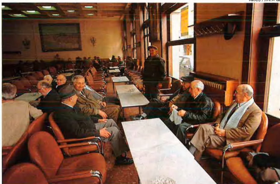
Dalt, clients habituals del casino de Vila-real. A sota, socis veterans de l'Ateneo Sueco del Socorro. Els casinos ja no tenen, com en èpoques passades, clientela jove: les formes socials han canviat moltíssim.