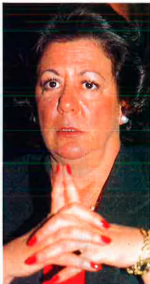
Rita Barberà (PP) ha fagocitat Unió Valenciana.