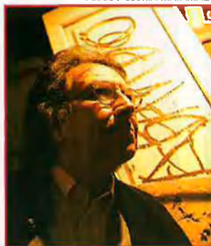
▲ Antoni Tàpies