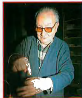
▲ Joan Brossa