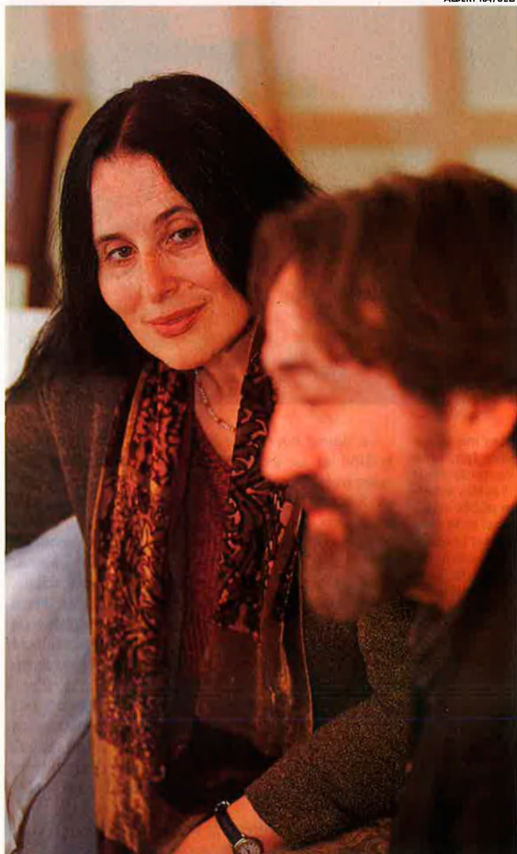
Montserrat Figueras (esquerra) i Jordi Savall (dreta). Van fer aparèixer la seva primera formació, Hespèrion XX, ara fa 25 anys.