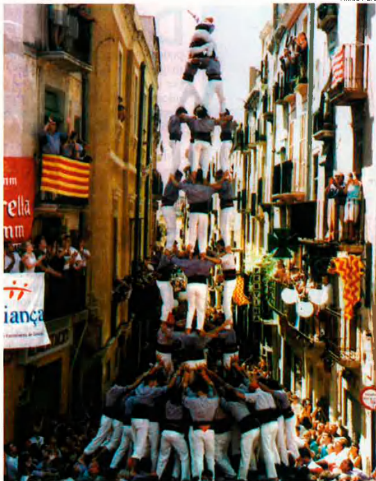
Quatre de nou amb folre. Aixecat per la Colla Jove dels Xiquets de Terragona a la seva ciutat el 19 d'agost del 98.