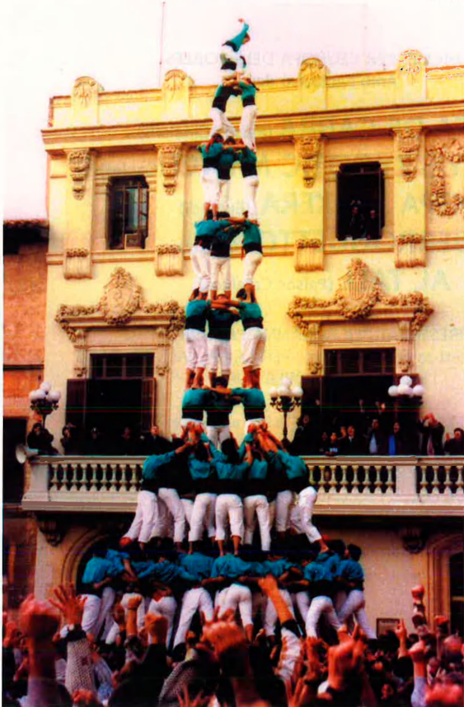
Tres de deu amb folre i manilles. Va ser carregat per primera vegada per la Colla dels Castellans de Vilafranca a la capital del Penedès el 15 de novembre del 98.

Sant Jordi marca l'inici oficial d'una nova temporada castellera plena d'al·licients, tot i que durant la passada es van batre tots els rècords.