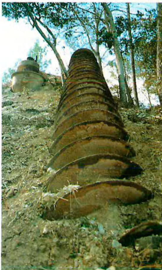
A dalt, 'La cupula dels sants', encara en procés de construcció. A sota, El meu compromís amb la terra .

d'un context natural treballat expressament per a elles –o viceversa–, i on la mateixa acció sobre el bosc, les construccions, les intervencions, són també obra d'art .