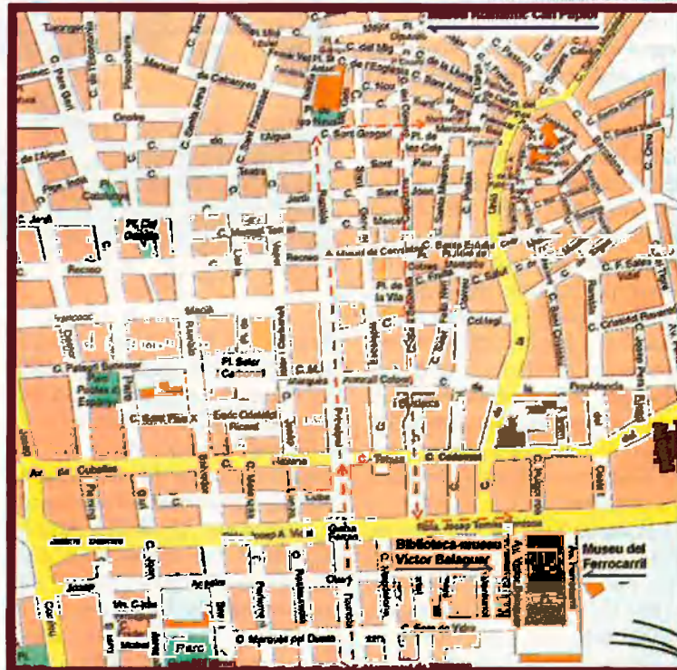
CONSELL COMARCAL DEL GARRAF

Detall de la decoració de Can Pahissa, a Vilanova. Aquesta és una de les poques cases d'indians que es poden visitar.