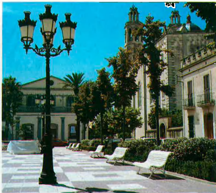
CONSELL COMARCAL DEL GARRAF

El carrer Illa de Cuba, paral·lel al de Francesc Gumà, fa honor al seu nom i presenta la concentració més gran de cases d'indians de Sitges. Baixant el carrer trobarem a esquerra i dreta (als números 34 i 35) dues joies: Villa Avelina és ara un restaurant, El Xalet, la qual cosa permet —a canvi de menjar-hi, és clar— veure l'interior, cosa estranya en la majoria d'edificis d'"americans", que continuen tancats al públic. Al davant, la casa de