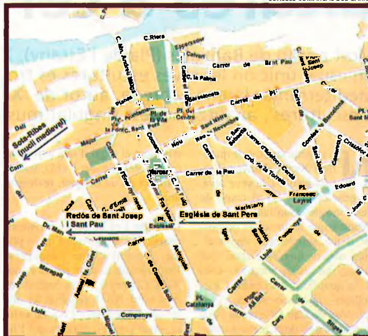
CONSELL COMARCAL DEL GARRAF