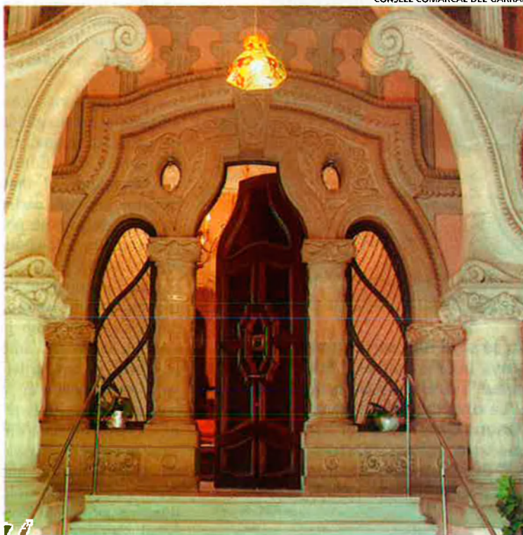
CONSELL COMARCAL DEL GARRAF

Entrada de Can Pahissa. Una de les mostres de modernisme que es poden trobar a Vilanova i la Geltrú.