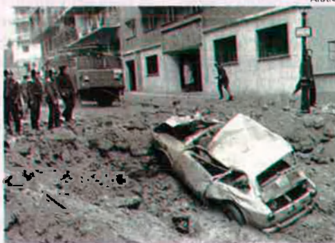
L'atemptat a Carrero Blanco va provocar un enduriment del règim franquista.

L'Espanya que va veure morir Puig Antich era un país que es debatia entre els espasmes d'un règim tronat que defallia i els aires nous de renovació que, tímidament, intentaven d'obrir-se pas. El gran terrabastall del 20 de desembre de 1973, amb la voladura controlada de l'almirall Carrero Blanco havia anunciat la fi inevitable d'un sistema que només podia perpetuar-se a còpia de terror. L'Espanya de final del 1973 i començament del 1974 havia assistit a la venjança més dura organitzada contra el moviment sindical, el procés 1.001 contra dirigents de Comissions Obreres. D'una altra banda, els mateixos dies en què Puig Antich era executat hi hagué un enfrontament sense precedents entre l'Església catòlica i els sectors més obtusos del franquisme: l'intent, per una banda, d'expulsar del país el bisbe Antonio Anoveros de Bilbao i l'amenaça d'excomunió vaticana, d'una altra, contra els jerarques del règim. L'insulsi "Esperit del 12 de febrer", una ridícula farsa d'oberturisme, fou clarament destruït pel garrot aplicat a Puig Antich. Carlos Arias Navarro, "el carnicero de Málaga", havia parlat aquell dia de "sumar, antes