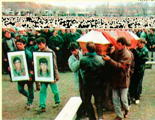
Al Kosovo hi ha hagut en deu anys 2.000 morts i 300.000 refugiats. Milosevic l'ha governat de manera despòtica.

faci abans que arribi a un acord de pau amb Israel. I el mateix pel que fa al Líban, a qui l'OTAN considera un satèl·lit de Síria.