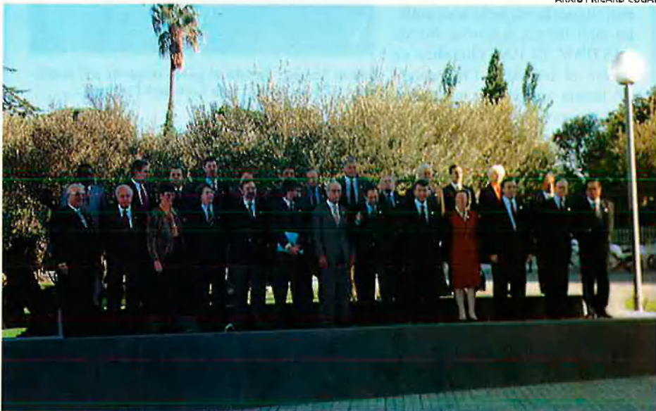
Cimera de l'Associació Euromediterrània impulsada per la UE en l'anomenat Procés de Barcelona. L'OTAN, amb el Diàleg Mediterrani, hi vol tenir una relació de complementarietat.

Algèria, tot i la insistència espanyola per integrar-lo en el Diàleg, de moment és rebutjat per la crisi interna que viu. Fonts properes a l'OTAN asseguren, però, que cal utilitzar la possible incorporació com a "pastanaga" perquè els militars democratitzin el país. El cas de Líbia s'explica per la seva condició de proscrit a ulls de l'ONU i especialment dels EUA, que acusa Gaddafi de fomentar el terrorisme internacional. Pel que fa a Síria, té algunes possibilitats d'entrar-hi, però és impossible que ho