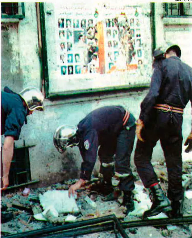
Atemptat a Algèria. El terrorisme és un dels problemes que l'OTAN vol combatre.

El comandant en cap de les Forces Aliades de la Regió Sud de l'OTAN (AFSOUTH), l'almirall Joseph Lopez, està convençut que la regió Mediterrània és la "més complexa d'Europa, i potser la més