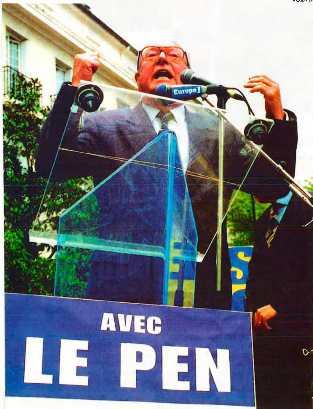
Jean-Marie Le Pen, fundador i ànima del Front National. És un home fet a si mateix, orgullós i impulsiu, amb aires megalomaniacs que el poden dur als pitjors excessos.

D e tot l'enrenou aixecat amb la divisió del Front National francès aquestes últimes setmanes, l'única satisfacció segura per als demòcrates ha estat l'intent d'enregistrar el nom del partit extremista, que va emprendre, a començament de desembre, una revista satírica, Charlie Hebdo .