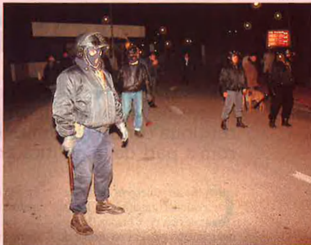
Servei d'ordre de Le Pen al Meeting 92. L'FN ha viscut una pugna especialment virulenta a Catalunya Nord.

La federació departamental del Front National a la Catalunya Nord és una de les seixanta-cinc federacions que segueixen Bruno Mégret i que, per tant, es van adherir a la convocatòria d'un congrés extraordinari de la formació ultradretana que es va fer a la ciutat provençal de Marignane el cap de setmana passat. Aquesta incorporació a les files mégretistes no va ser immediata i va pro-