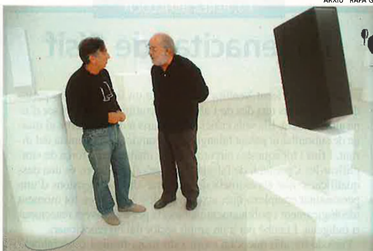
ARXIU RAFA GIL

— Sense tradició de lectures i amb escàs ambient, com es podia ser nacionalista en aquells anys?