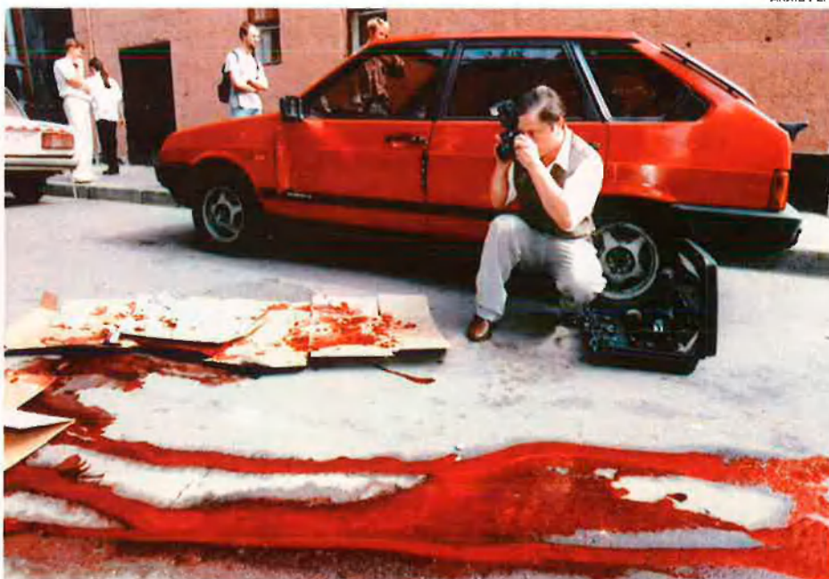
Petges de l'atemptat contra dos policies a Moscou comès per la màfia. Encara que hi ha constància de grups mafiosos des del segle XIX, és des el 1991 quan es desborda el seu poder.

Per la dreta parlamentària, contrària a la iniciativa, els arguments es basaven en la necessitat de llibertat d'acció per a la policia federal perquè pogués controlar els riscos que assetgen la democràcia occidental: terrorisme islàmic, crim organitzat i extrema dreta.