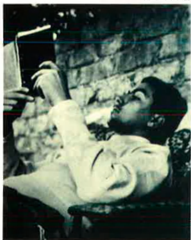
ARXIU / TÀPIES

amb alguna sèrie d'aquestes que fan a TV3 i no m'agraden.