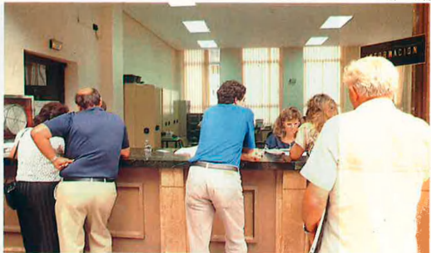
La visita a les oficines d'Hisenda és inevitable per constituir una cooperativa. Cal anar-hi i donar d'alta l'Impost d'Activitats Econòmiques, l'IVA i l'Impost de Societats.

molts impostos se li bonifiquen en un percentatge molt alt. Per constituir-se, una cooperativa només gasta les despeses de notari, que a més són molt reduïdes per a aquest tipus d'empreses: una cooperativa de capital modest, amb 50.000 pessetes té prou per a despeses de notari. En l'impost de transmissions patrimonials, tenen una bonificació del 100% i en el IAE, se li bonifica un 95%. És a dir, que mentre que a Barcelona una empresa modesta pot pagar de 100.000 a 150.000 pessetes de IAE, la cooperativa pagaria 5.000 o 7.500 pessetes. La resta ja no les paga. En l'Impost de Socie-