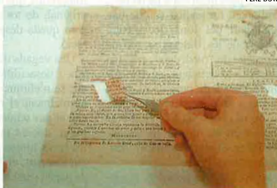
Cristina Montaner, en ple procés de restauració d'un document. Sempre que és possible, la restauració es fa manualment, tret dels documents de paper agredits per rosegadors o per la composició química de la tinta.