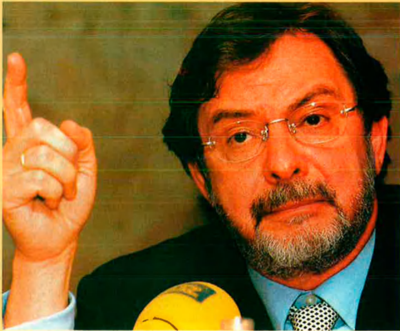
Juan Luis Cebrián. El conseller delegat del grup Prisa i ex-director d' El País va inaugurar el setè Congrés de Mitjans de Comunicació.