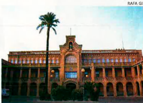
Façana de l'hospital Valencia al Mar. Aquest centre ha guanyat 1.500 milions des del 1996.

atendre l'any passat 8.880 pacients de la sanitat pública —4.000 més que el següent hospital que més pacients va rebre— i ha guanyat per aquest concepte uns 936 milions de pessetes, segons les dades a què ha tingut accés EL TEMPS. Des del 1996 Valencia Al Mar ha guanyat uns 1.500 milions