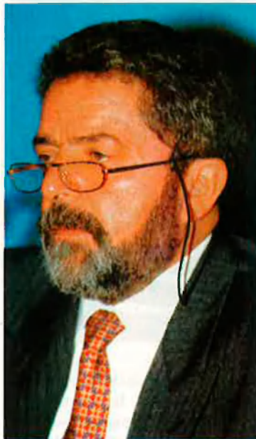
Luiz Inácio da Silva lidera el principal grup opositor. Da Silva acusa Cardoso d'ignorar les desigualtats.