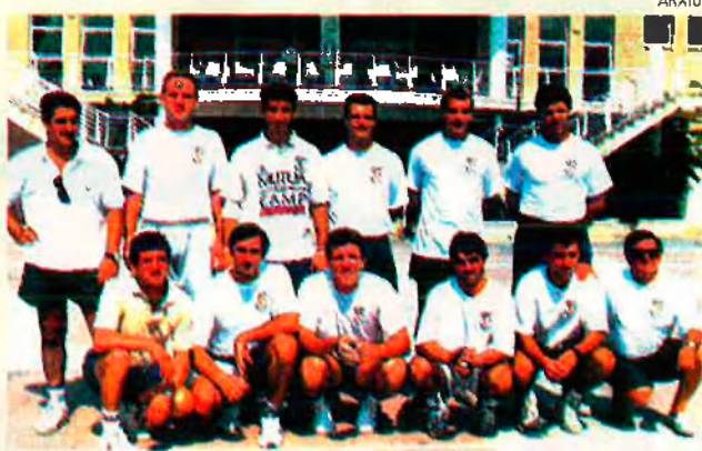
Membres de la selecció valenciana al campionat europeu de l'any passat. Enguany, s'hauran d'enfrontar també a seleccions sud-americanes.

Per tal d'equilibrar les possibilitats de totes les seleccions participants, les partides es juguen segons una normativa conjunta. Per a la selecció valenciana, la principal dificultat és jugar en un trinquet que té forma d'embut i sense parets, i no en un carrer natural. Un altre dels canvis és que en lloc