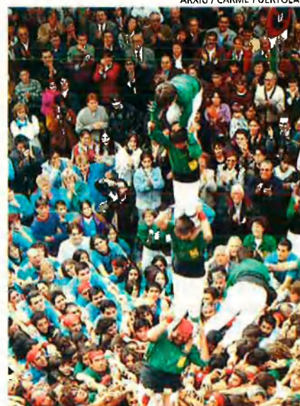
A la Costa Daurada, també podem trobar encisadors espais de muntanya, com el Montsant (a la foto de l'esquerra), i manifestacions festives d'origen ancestral, com els celebèrrims castells.