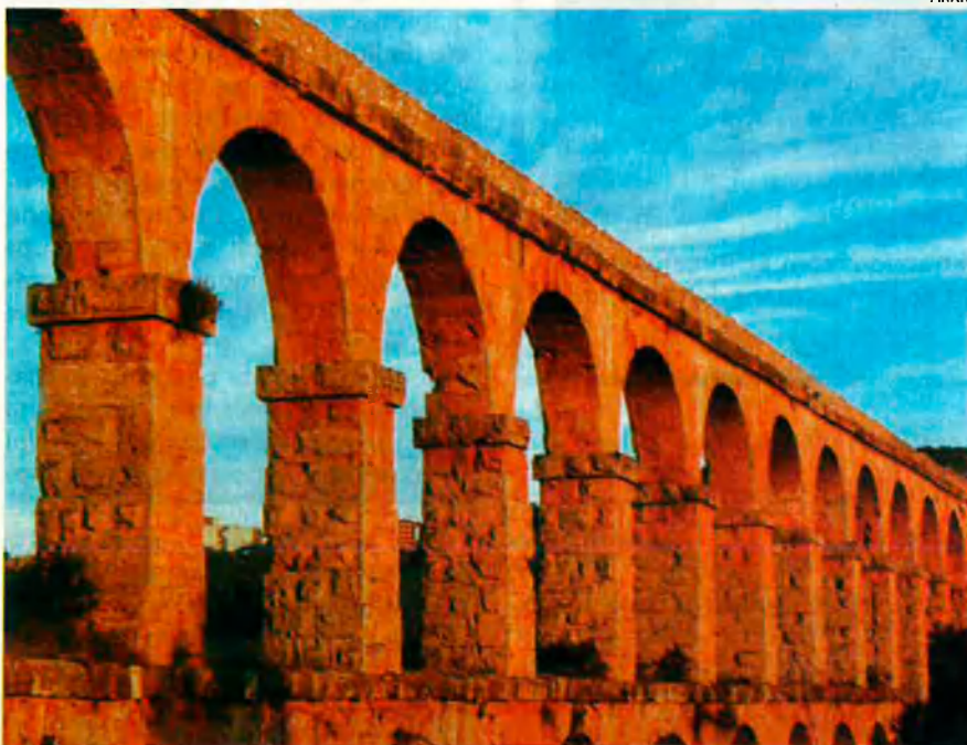
L'aqüeducte romà de Tarragona és una de les valuósíssimes peces del llegat que la civilització romana va deixar en aquestes terres.

Els seus paisatges són insòlits i plens de contrastos. Així passen d'uns arrossars impecables a dunes d'aspecte desèrtic, i de la fauna exuberant dels estanys, maresmes i ribes de l'Ebre a platges extenses i tranquil·les.