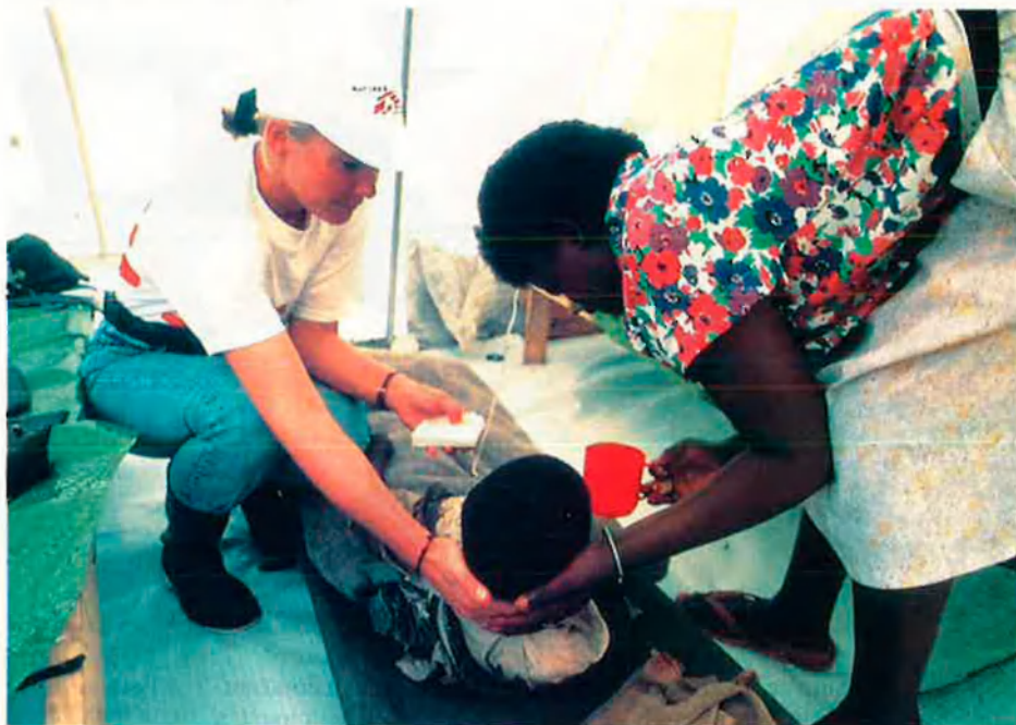
Els nens també pateixen les conseqüències dels conflictes bèl·lics i els èxodes que produeixen. Fotografia d'una metgessa de MSF a Rwanda.

el percentatge de morts es va reduint i això ens dóna forces per continuar lluitant.