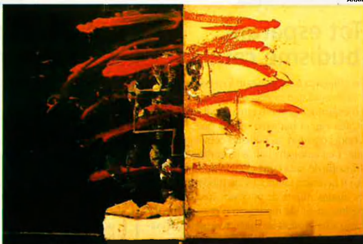
En el món de les arts plàstiques, a Catalunya, Antoni Tàpies ha treballat molt sota una visió orientalista. Un altre pintor català influït per l'Orient fou Joan Miró.

no s'han apartat tant dels fets psíquics fonamentals per a perdre's en la sobrevaloració, l'exageració i el desenvolupament unilateral d'una única funció psíquica. Els xinesos mai no han deixat de reconèixer les paradoxes i la polaritat inherent a tot allò que és viu. Les forces oposades sempre s'equilibren —és el senyal d'una cultu-