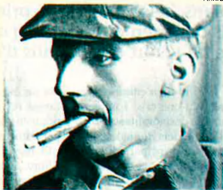
Bertolt Brecht. Fa cent anys que va nèixer.

No cal ni dir que aquest despullament ha estat tremendament beneficiós ja que ens ha permès que gaudim de la saviesa dramàtica i de la qualitat literària d'unes