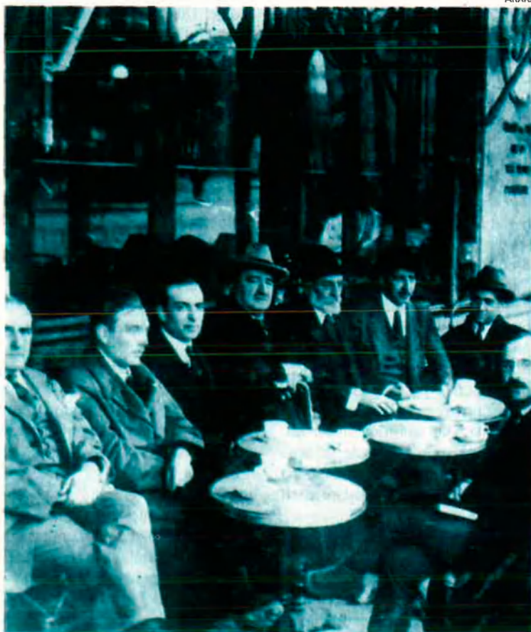
Al centre de la fotografia, Blasco Ibáñez amb Miguel de Unamuno a la terrassa d'un café madrileny. La cort intel·lectual de la "Generació del 98" va menysprear Blasco pel fet de ser un escriptor de segona.

La Diputació també hi ha aportat el seu gra de sorra. La institució provincial s'ha mostrat, en aquesta ocasió, més plural i la seua celebració particular tracta, malgrat la diferència política, els aspectes més "desavinents" de don Vicent: la seua prosa periodística incendiària d' El Pueblo o el seu mandat com a diputat