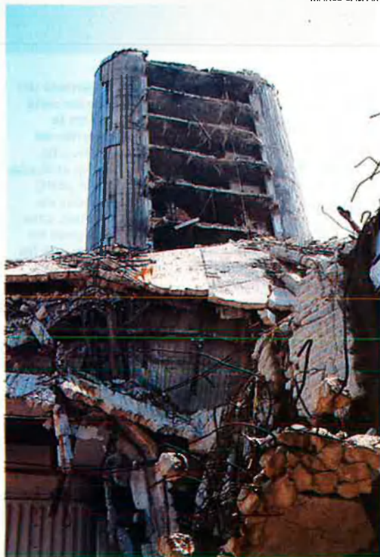
Sarajevo. L'exemple de la destrossa de Bòsnia plana aquests dies a la capital de Kosovo, Pristina.

part de la població és albanesa. L'única mesura de pressió real contra Milosevic va ser l'amenaça de tornar a suspendre les inversions estrangeres a territori iugoslau, un país que encara no ha sortit del marasme econòmic causat per les sancions internacionals.