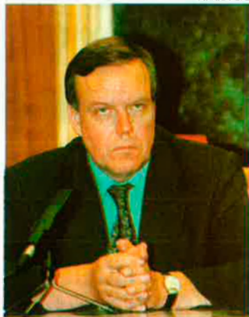
Volker Rühe, ministre de Defensa alemany. Rühe ha desdramatitzat la proliferació de delictes a l'exèrcit, que qualifica de "casos aïllats".

dels jacobins i l'acord va concretar-se en el carbó i l'acer. França se sentia forta davant una Alemanya afeblida. El canceller Adenauer va enterrar dia la idea bismarkiana de l'Europa alemanya i va confiar en l'Alemanya europea.