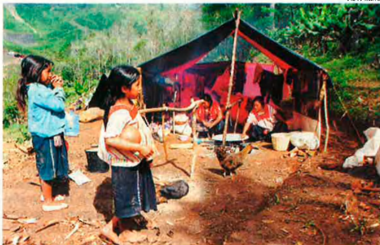
Una imatge del campament de Pol-hoí. Hi viuen més de 7.000 persones.

mateix moment, el pànic es va estendre per tota la regió i 7.000 persones van emprendre un èxode que s'acabaria a Pol-hoí, el campament zapatista més gran de Chiapas.