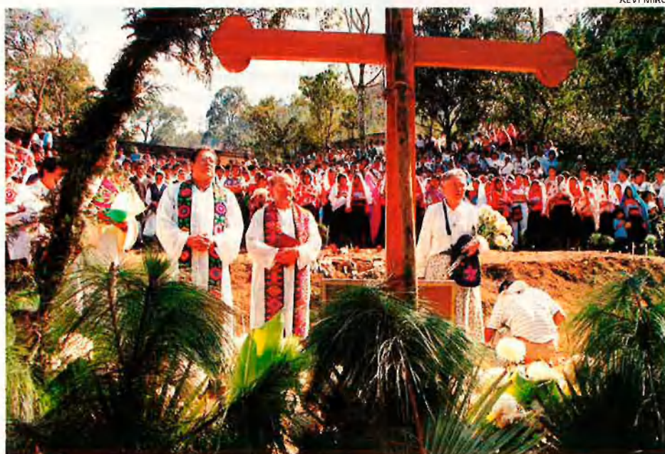
Els capellans i tot el poble d'Acteal, davant la fossa comuna de les víctimes de la matança del passat 22 de desembre. La responsabilitat, si més no passiva, de la policia és clara.

Lluny de l'espectacularitat d'altres conflictes, la guerra de Chiapas té una sortida difícil. La persistència de les xarxes caciquistes, la manca de terra i la falta de democràcia exigeixen una reforma constitucional que afectaria tot Mèxic. La reforma no arriba, i la tensió va en augment.