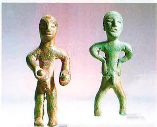
Dalt, un genet dret davant del seu enemic, del segle V aC. A sota, orants nus. I al costat, una gerra amb decoració orientalitzant de Casa Saltillo, a Sevilla, del 650-550 aC.