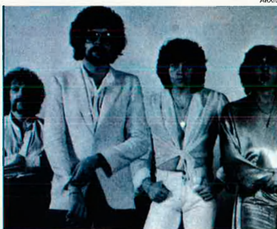
L'Electric Light Orchestra (E.L.O.) és un dels grups inclosos en la banda sonora de 'Boogie nights'. La música és fonamental per entendre el context del film.

Per estimular la carrera comercial del film ja hi ha en les tendes un parell de discos que reuneixen les cançons més