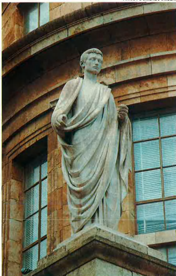
Al costat de parcs d'atraccions i platges àmplies, la Costa Daurada té l'encant d'uns indrets plens d'història.

la visita a l'obra del gran Domènech i Montaner a la capital del Baix Camp es pot anar a l'Institut Pere Mata que té uns mosaics i vitralls excel·lents.