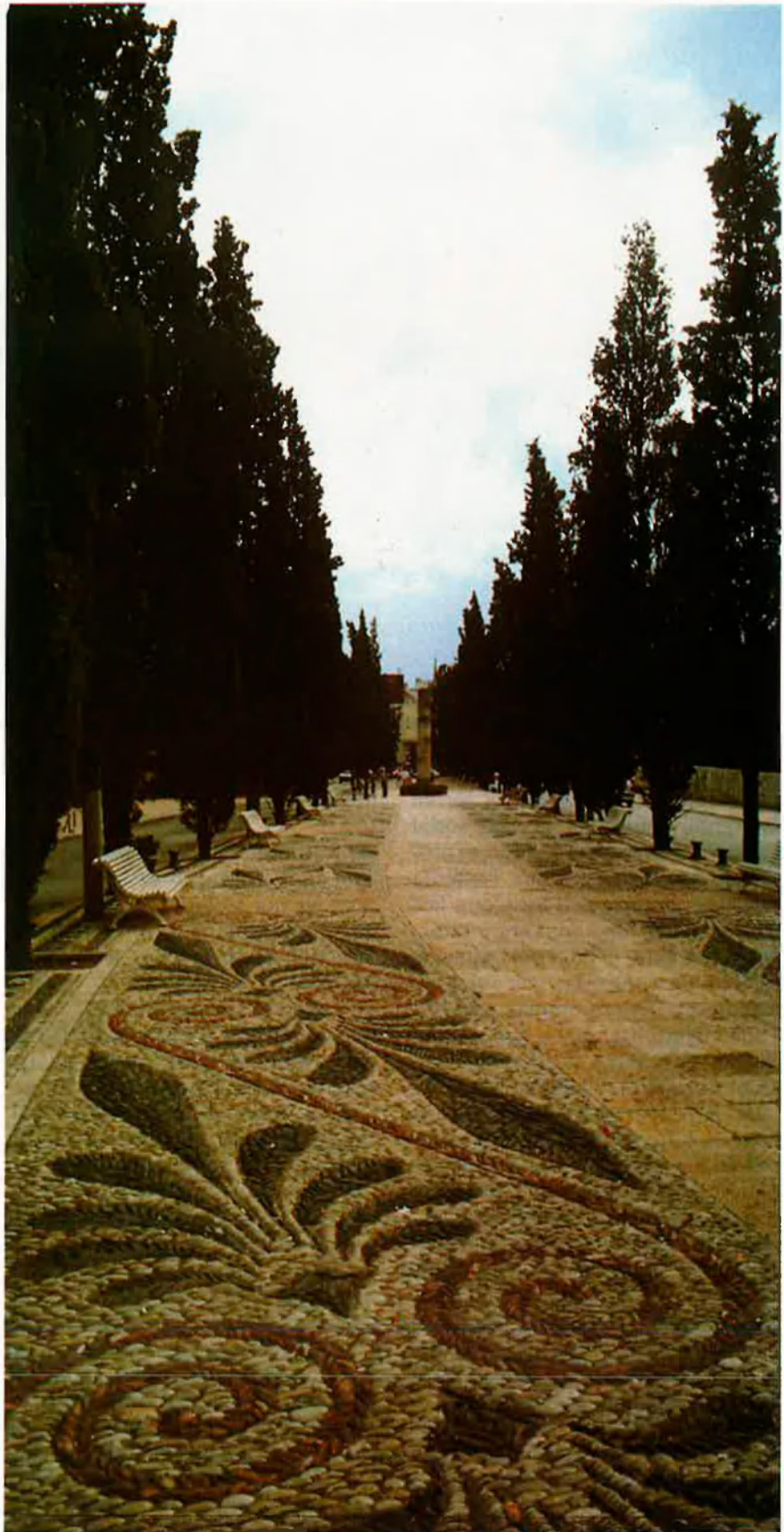
Tarragona va ser un dels centres vitals de l'imperi romà. La ciutat conserva multitud d'emprentes d'aquella època, com l'emblemàtic amfiteatre (a la pàgina del costat).

L'amfiteatre, que data del segle II dC, ha mantingut, en canvi, la seva forma a través del temps. Els enginyosos constructors romans van aprofitar el pendent d'un petit turó vora mar, a la roca del qual van excavar una bona part de les graderies. Tret de la part conservada de les muralles que suava esmentàvem, és un dels pocs edificis romans que es pot observar gairebé tal com era quan el van construir. La seva pervivència en el temps és admirable i ha sobreviscut a una església visigòtica bastida dintre seu i a una altra de romànica; ni de l'una ni de l'altra, no en tenim grans traces avui dia, sinó unes poques restes. La seva proximitat a mar, que li serveix de fons, fa que sigui un lloc particularment atractiu.