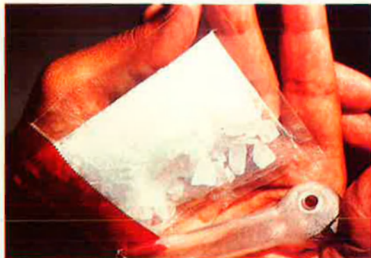
Una mostra d'ice'. Droga química d'intensos efectes.

les fumades, que vaig descuidar el tràfic, i els majoristes ja no confiaven en mi. Me tallaren el subministrament, i ma mare va trobar-me la pasta que amagava a casa. La cabrona volia denunciar-me a la policia! La vaig convèncer perquè no ho fera, però es va quedar la guita. Me vaig veure sense un duro. Per aconseguir base, estiguí a punt de mamar-li-la a un majorista. Per sort, no arribí a fer-ho. Em va venir la raó i jo mateix em vaig forçar a deixar la base. Ara continue en el negoci, perquè els traficants es tornen a confiar de mi. Me faig uns quants grams de coca pel nas, però només els caps de setmana que isc de nit. Ja no toque material, simplement pose en contacte uns camells mitjans amb majoristes, i quan vull fer-me farlopa , en compre. Ser intermediari és la millor manera de fer negocis: guanyes diners, i no t'agarren mai amb res. Fins i tot els meus pares crec que han acceptat la situació. J. M. O.