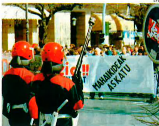
En la pàgina anterior, una manifestació contra ETA a Bilbao. Dalt, una concentració de rebuig contra l'empresonament de la Mesa Nacional d'HB.

I molta culpa en té l'anomenat "tercer espai sociològic basc". El mateix que havia reaccionat contra l'empresonament de la Mesa d'HB i que havia convocat una mobilització unitària sense precedents. Molts noms de la cultura, la universitat i el periodisme havien manifestat