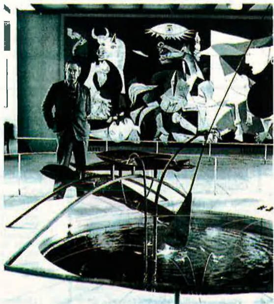
Calder amb la 'Font de mercuri' (1937). Estava en el seu escenari original: el Pavelló de la República.

A l'esquerra, el "Retrat de Joan Miró" (1930) testimonia la relació d'amistat entre els dos artistes.