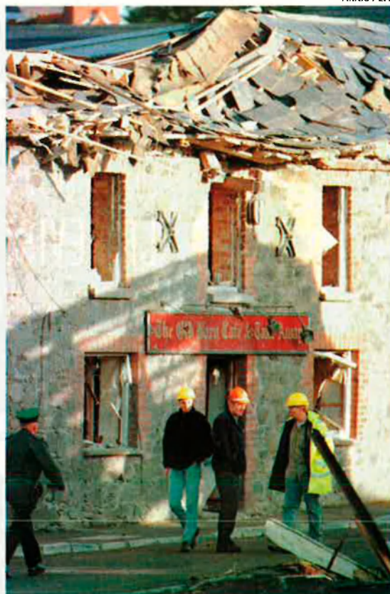
A la pàgina del costat, Gerry Adams davant la porta tancada del Castell de Stormont, on se celebren les converses de pau. El Sinn Féin finalment ha accedit a les negociacions. Dalt, atemptat reivindicat per un grup dissident de l'IRA el passat mes de setembre.

A 180 graus de la posició de Paisley, el Sinn Féin ha començat a perdre suports pel flanc més ultra. L'atemptat sense víctimes de l'estació de policia del poble protestant de Markethill, el 16 de setembre passat, reivindicat per una organització paramilitar dissident de l'IRA i que es diu Comando de Continuitat Militar, és una provocació. Però és també una advertència: la treva decretada per l'IRA no la segueixen tots. Dotze membres del Sinn Féin han deixat igualment l'organització en protesta pel caire que va agafant el procés de pau.