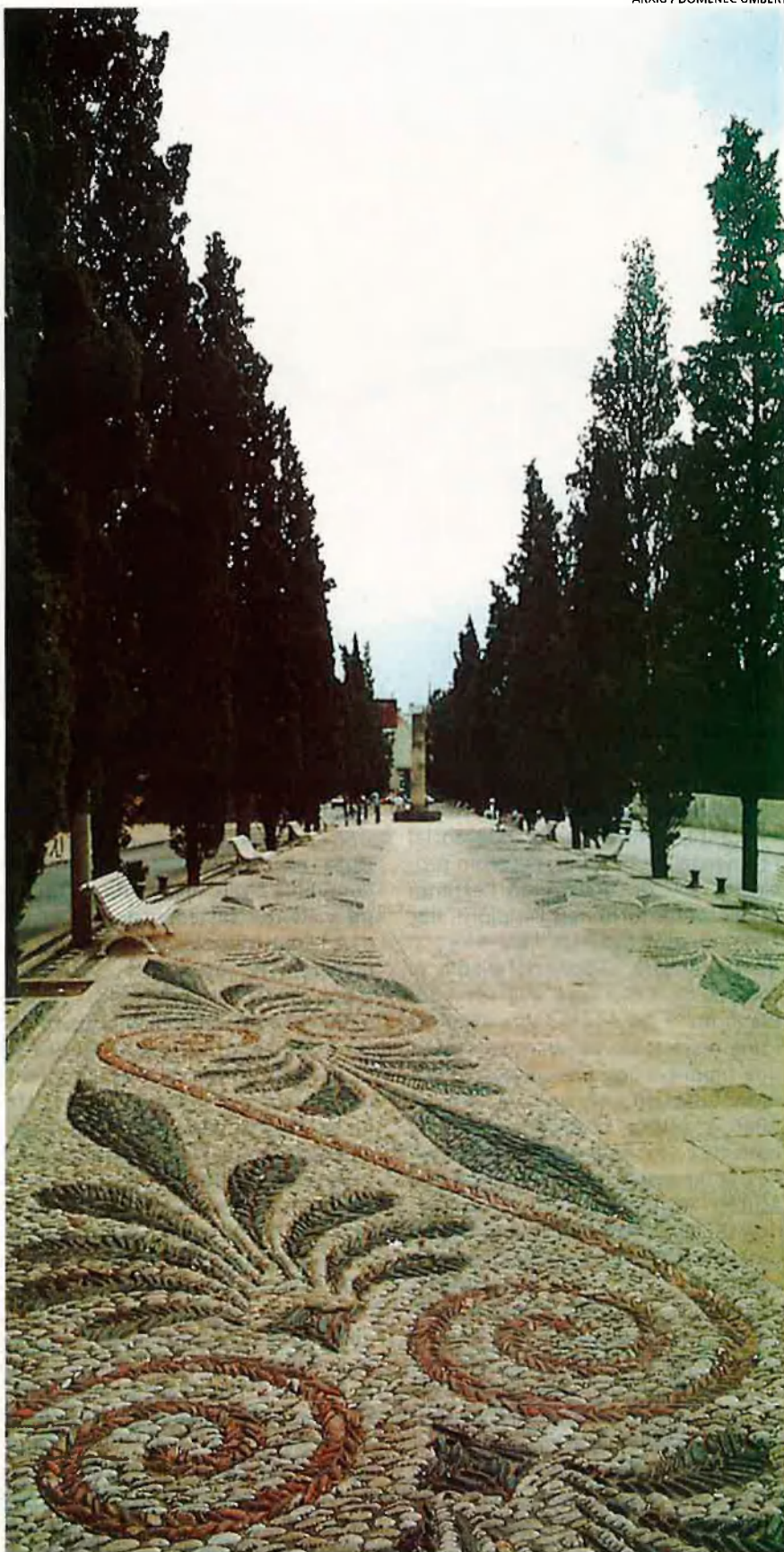
Tarragona va ser un dels centres vitals de l'imperi romà. La ciutat conserva multitud d'emprentes d'aquella època, com l'emblemàtic amfiteatre (a la pàgina del costat).

L'amfiteatre, que data del segle II dC, ha mantingut, en canvi, la seva forma a través del temps. Els enginyosos constructors romans van aprofitar el pendent d'un petit turó vora mar, a la roca del qual van excavar una bona part de les graderies. Tret de la part conservada de les muralles que suara esmentàvem, és un dels pocs edificis romans que es pot observar gairebé tal com era quan el van construir. La seva pervivència en el temps és admirable i ha sobreviscut a una església visigòtica bastida dintre seu i a una altra de romànica; ni de l'una ni de l'altra, no en tenim grans traces avui dia, sinó unes poques restes. La seva proximitat a mar, que li serveix de fons, fa que sigui un lloc particularment atractiu.