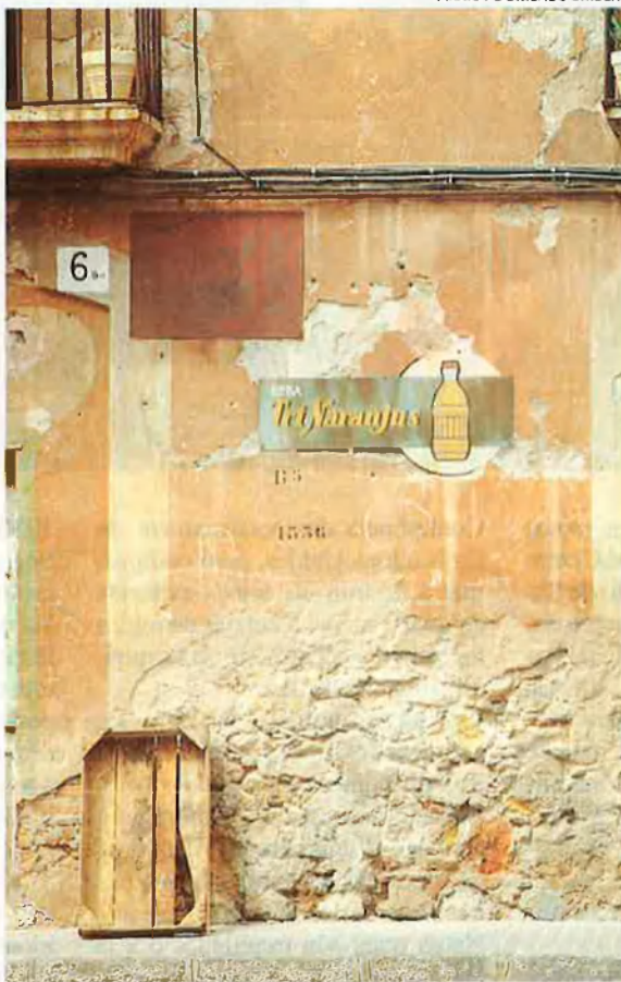
Al costat de parcs d'atraccions i platges àmplies, la Costa Daurada té l'encant d'uns indrets plens d'història.

la visita a l'obra del gran Domènech i Montaner a la capital del Baix Camp es pot anar a l'Institut Pere Mata que té uns mosaics i vitralls excel·lents.