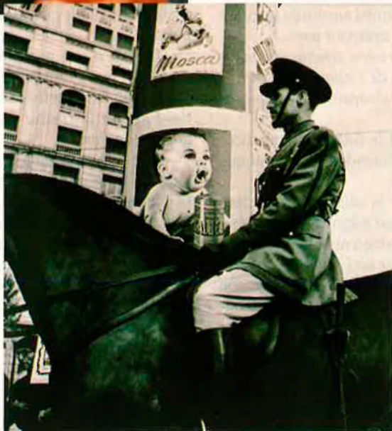
ARXIU / CATALÀ ROCA

—Avui, el blanc i negre ha quedat restringit a un llenguatge més aviat artístic i expressiu.