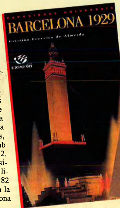
Una col·lecció sobre les exposicions universals, dedica un llibre sencer a la de Barcelona del 1929. Presentà innovacions impactants.