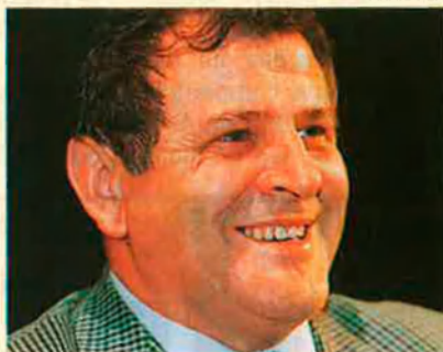
Vladimir Meciar. El primer ministre eslovac juga la carta nacionalista a un any de les eleccions generals al seu país.

cikovo-Nagymaros al riu Danubi representa un altre escull en la relació entre Hongria i Eslovàquia. Projectada conjuntament pels governs comunistes de Praga i Budapest als anys setanta, Hongria se'n retirà al·legant que la desviació d'una part del cabal del Danubi –que delimita part de la