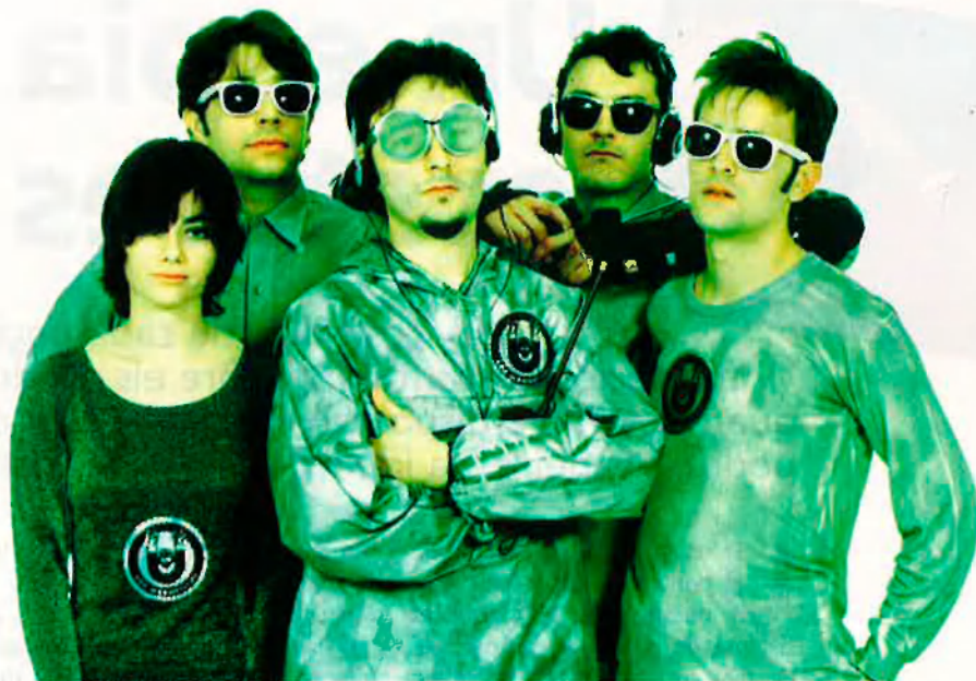
Los Magnéticos ofereixen una imatge bastant sideral. Els grups alternatius valencians beuen d'influències tan distintes com obertes.