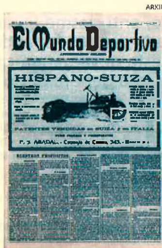
Primer número de 'El mundo deportivo'. És un dels dos diaris esportius que s'editen a Barcelona.