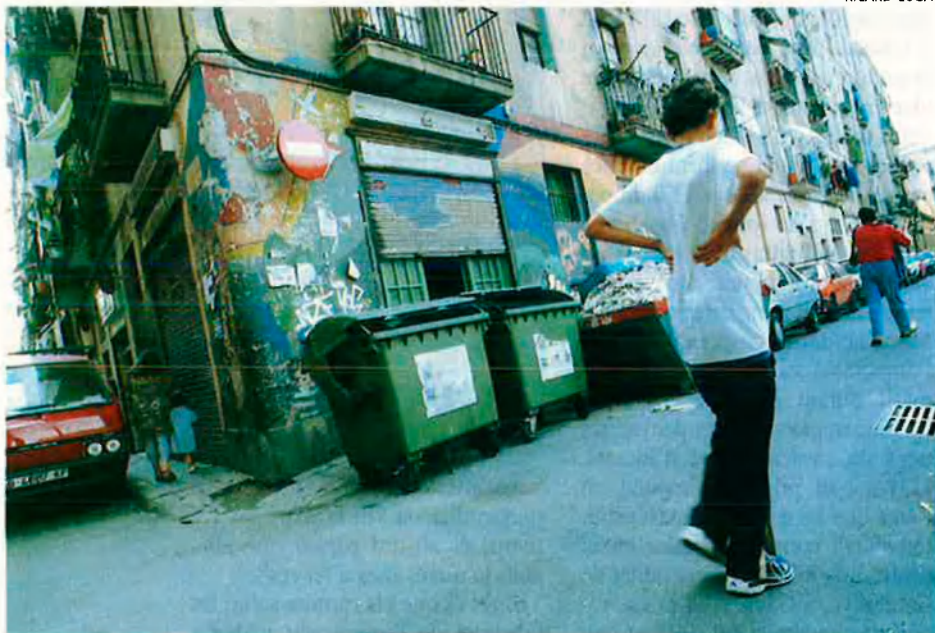
El Casal d'Infants. S'ha vist involucrat indirectament en l'afer de la presumpta xarxa.