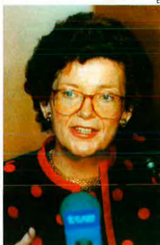
D'esquerra a dreta, el primer ministre britànic, Tony Blair, la ministra per Irlanda del Nord, Mo Mowlan, el reverend unionista radical ian Paisley i l'actual presidenta d'Irlanda, Mary Robinson. Les converses de pau són fruit de l'acord entre les administracions britànica i irlandesa, malgrat l'oposició d'un sector de l'unionisme.

És indiscutible que Tony Blair, amb els referèndums d'Escòcia i Gal·les ha obert un procés de descentralització i ha insistit a remarcar que no té camí de tornada. Així, no és estrany que Blair també tingui previst per a Irlanda del Nord d'arribar a establir-hi alguna mena d'autonomia.