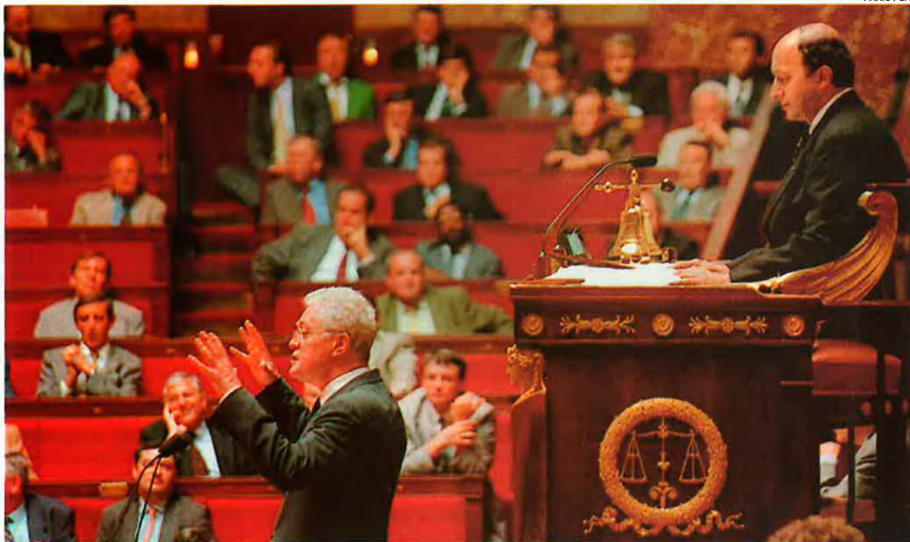
Lionel Jospin en persona llançava el passat 25 d'agost la idea que calia incentivar les noves tecnologies. L'administració pública, donant-ne exemple, s'obrirà a la nova xarxa de comunicació global amb un seguit de mesures.