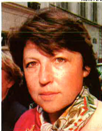
Martine Aubry, ministressa de Treball del govern francès. El pla contra la desocupació preveu que en la creació de llocs de treball participen tant el sector públic com el privat.

quen una nova i lleugera recuperació, la crispació social s'ha reduït sensiblement i només la pol·lució ha donat maldecaps al llarg d'aquest mes d'agost als francesos, i encara a les grans ciutats. Com en el cas anglès, sembla que la tradicional treva política dels primers cent dies continuï perllongant-se. El primer ministre, Lionel Jospin té un 51% de popularitat, tres punts més que no el juliol, i fins i tot sembla que podria batre Chirac, en cas que s'avancessin les eleccions presidencials.